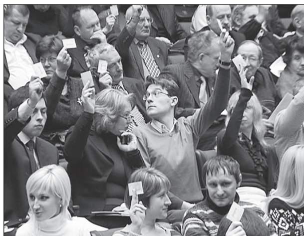
Установчі збори з формування громадської ради при Запорізькій облдержадміністрації

Найбільше у складі громадських рад при обласних державних адміністраціях та Раді міністрів Автономної Республіки Крим представлені громадські і благодійні організації, професійні спілки. Представники недержавних засобів масової