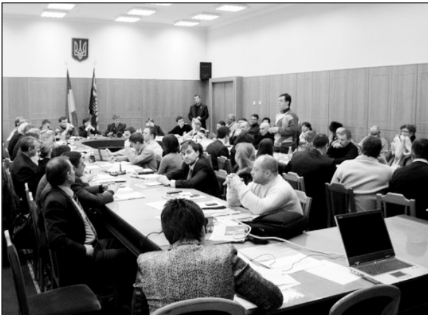
Перше засідання громадської ради при Донецькій облдержадміністрації

2) інформаційного забезпечення взаємодії органів виконавчої влади та громадських рад, зокрема щодо необхідності: встановлення інформаційних стендів в приміщенні органів виконавчої влади з інформацією про громадську раду; розміщення матеріалів про роботу громадських рад у місцевих ЗМІ (обласних, міськрайонних газетах, на місцевому радіо і телебаченні); заснування урядового періодичного видання, в якому за поданням органів виконавчої влади та громадських рад публікувати інформацію