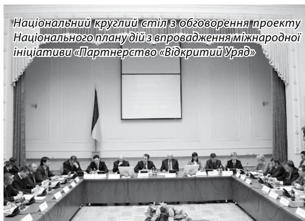
Національний круглий стіл з обговорення проекту Національного плану дій з впровадження міжнародної ініціативи «Партнерство «Відкритий Уряд»

Документ розроблено органами виконавчої влади за участю представників інститутів громадянського суспільства. Зокрема, у листопаді 2011 – січні 2012 року громадське обговорення проекту плану, підготовленого Мін’юстом, провели центральні та місцеві органи виконавчої влади. За результатами Секретаріатом Кабінету Міністрів було узагальнено понад 400 пропозицій. Доопрацювання документу здійснювала робоча група під головуванням Голови Держінформнауки В. П. Семиноженка за участю представників інститутів громадянського суспільства, Координаційної ради з питань розвитку громадянського суспільства при Президентові України, органів виконавчої влади, Секретаріату Кабінету Міністрів. 30 березня 2012 р. проект Плану дій з впровадження в Україні Ініціативи “Партнерство “Відкритий Уряд”